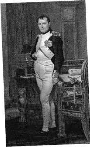
Napoleon Bonaparte a fost unul dintre cei mai mari admiratori ai lui Machiavelli.

practice: cum să pui mâna pe putere și cum să o păstrezi. Abordarea pe care o vom adopta în această descriere este realistă – și nu ar putea fi altfel fiind vorba despre secretarul Niccolò. Realistă din trei motive: pentru că vom descrie faptele politice așa cum s-au desfășurat acestea – nu cum ar fi trebuit să se desfășoare sau cum am vrea să fi decurs –, deoarece vom avea posibilitatea să constatăm până unde teoria machiavelică se bazează pe exemple reale ale istoriei și, în cele din urmă, deoarece vom demonstra că politica este o artă guvernată de realitate și de circumstanțe concrete, mult mai mult decât de principii ideologice și de compromisuri etico-filosofice.